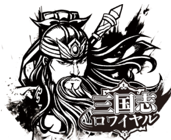
▲三国志ロワイヤルオリジナルステッカー2枚セット